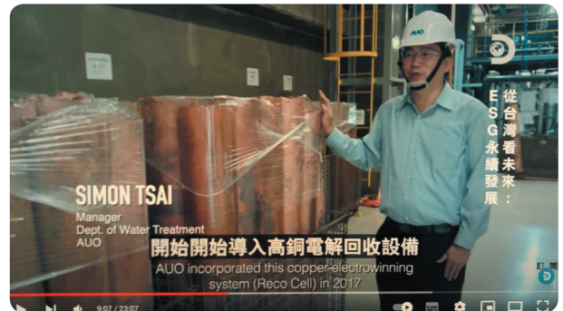
參與 DISCOVERY 影片拍攝

友達已連續12年入選道瓊世界永續性指數成份股(DJSI World)，於110年底將「永續委員會」轉型升級為「ESG 暨氣候委員會」，擘劃低碳轉型-邁向淨零新願景，結合公司雙軸轉型策略，逐步展開各項氣候行動，並參與Discovery頻道ESG推廣影片製播。