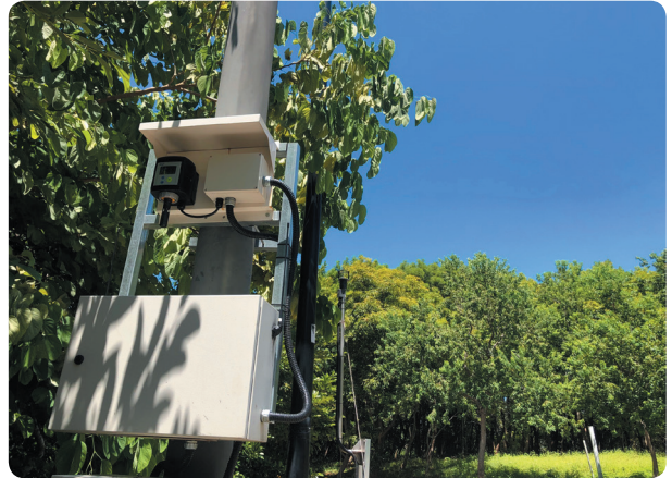
周界 IoT 物聯網偵測設備設置

后里廠除強化防制設備管理機制，嚴密監控各項防制設備操作狀況，於廠區周界自主性架設空氣品質 IoT (物聯網) 偵測設備，結合數據分析平台達到最佳監控管理。以 CVD Guardian 火焰 AI 辨識專案為例，針對火口阻塞異常造成燃燒不完全及處理效率降低，透過影像辨識系統即時比對 Guardian 火焰道數，將異常資料自動上拋以提早預警進行機台維護保養。